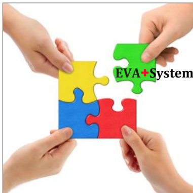
EVA ergänzt und entlastet Vermittler und Team