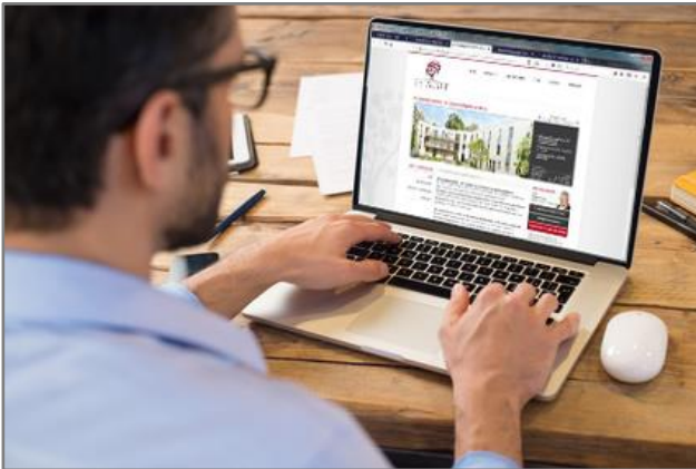
Interessent mit Kontaktformular im Internet: Die Leads werden von EVA vollautomatisch betreut und warm gehalten