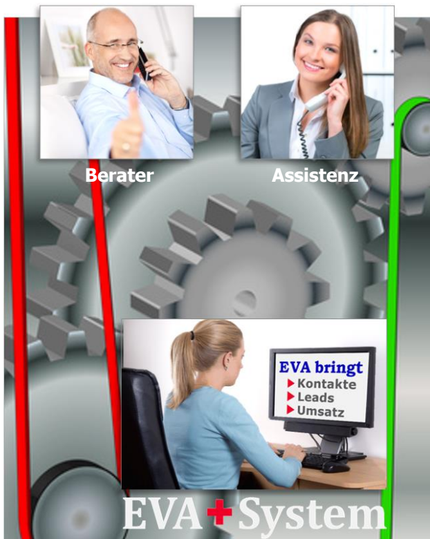
Berater, Assistenz und EVA arbeiten im EVA+System zuverlässig, zeitsparend und erfolgreich zusammen

Die anfangs schlechte Erfolgsquote von ca. 1:10 wird auch durch Fehler am Telefon verursacht. Dem Berater und seiner Assistenz ist nicht bewusst, wie schnell und aus welchen Gründen sie Kunden am Telefon verlieren. Telefontraining und Coaching steigert die Erfolgsquote auf 1:3 - Zeitaufwand und Vertriebskosten pro Abschluss sinken um mehr als 60 %. Die Sicherheit am Telefon wächst und Telefonate machen mehr Spaß.